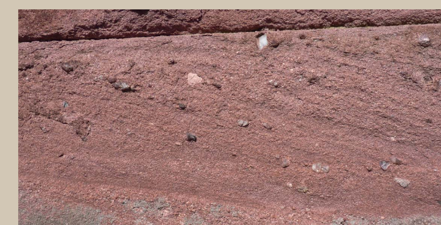
Geröllführender Sandstein in einem Tor am Mansfelder Ring 27 in Siebigerode

lich betriebenen Steinbrüchen jährlich bis zu tausend Mühlsteine hergestellt. Zeugnisse des bedeutenden Sandsteinabbaus von Siebigerode sind die nordwestlich der B 86 gelegenen Steinbrüche.