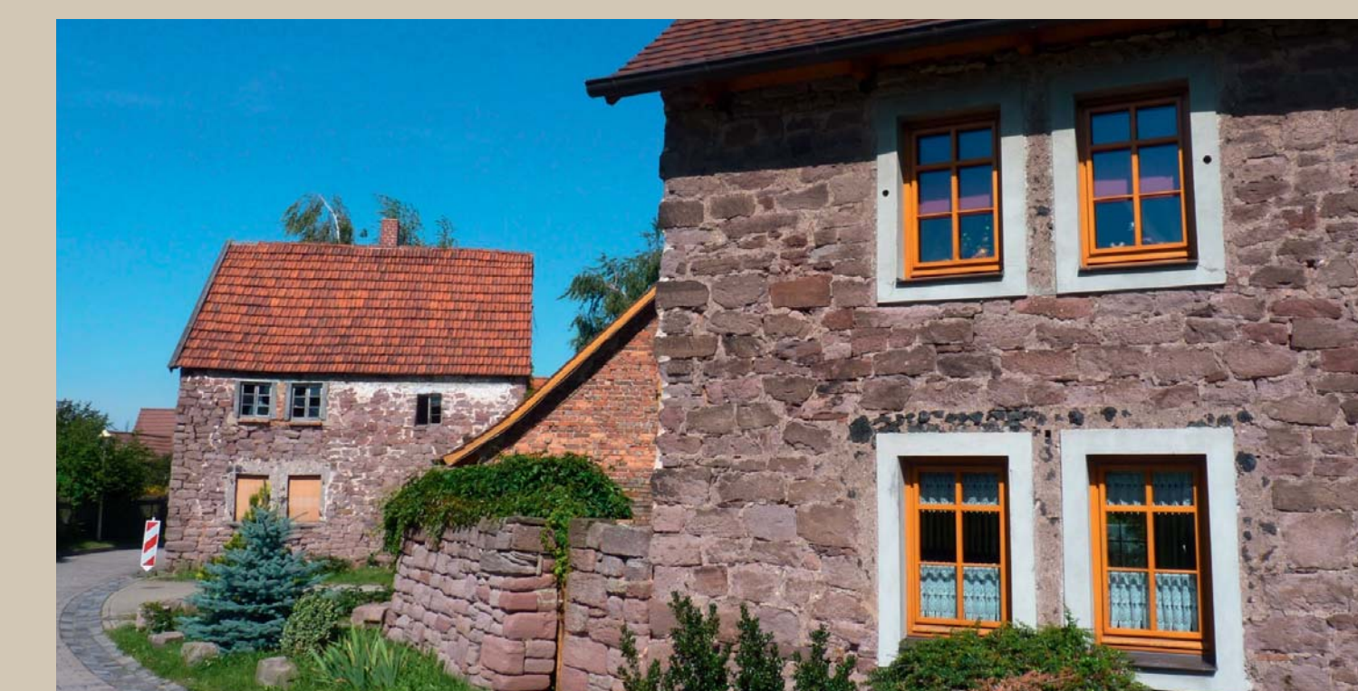
Sandstein als Baustein am Mansfelder Ring 21