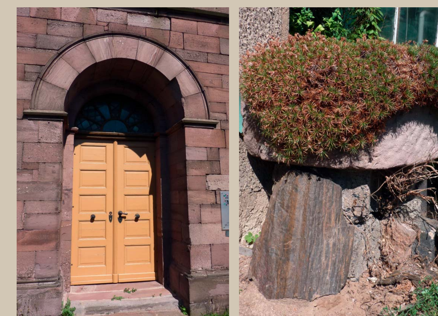
Links: Eingang zu St. Georg, Siebigerode Rechts: Stammstück unterm Mühlstein (D. Pfannschmidt)