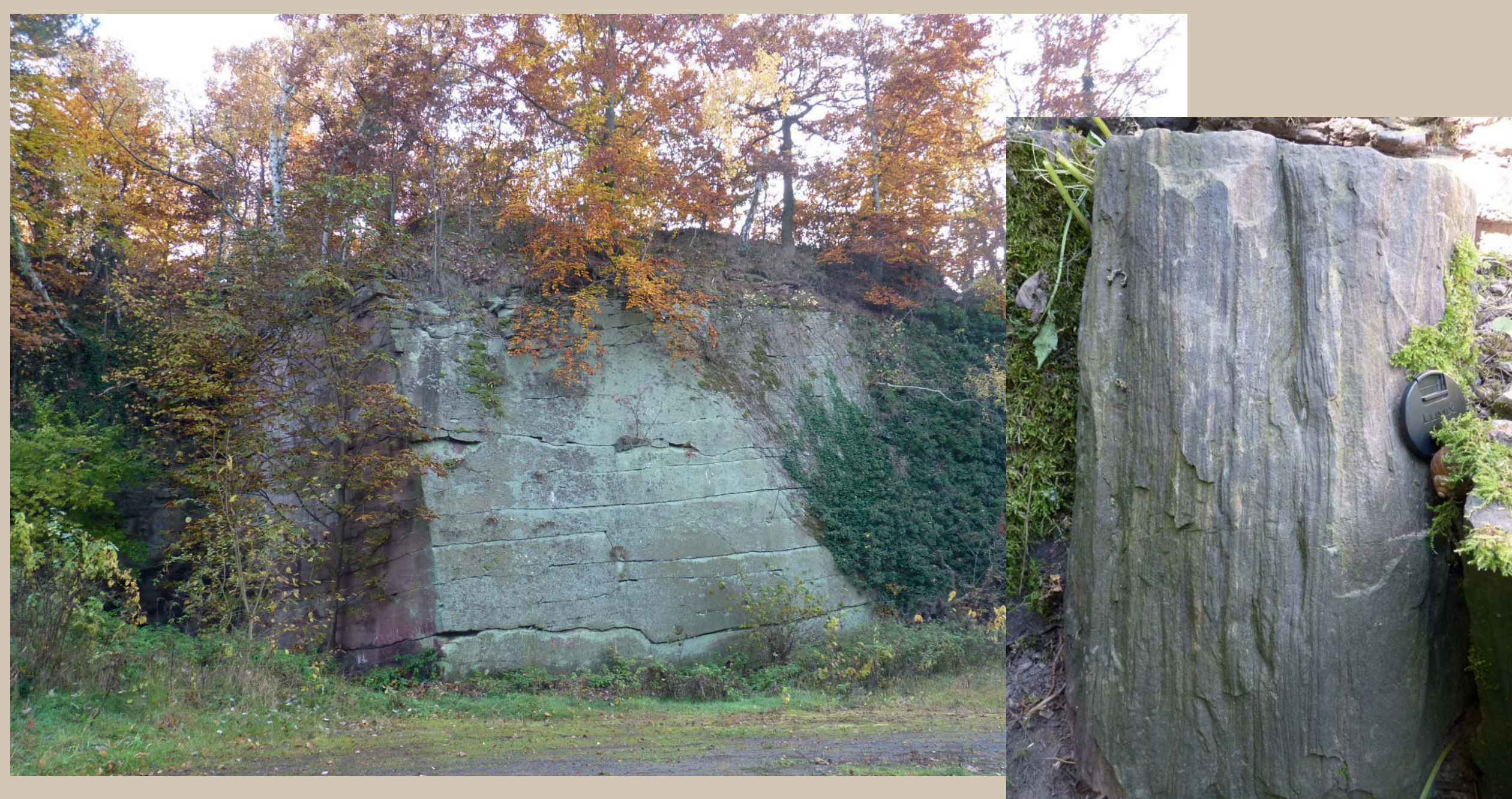
Südwand des Mühlsteinbruchs am westlichen Ortsausgang von Siebigerode

Beispiele von verkieseltem Holz aus dem Mühlsteinbruch von Siebigerode (Funde: D. Pfannschmidt, Siebigerode). Die Versteinierung des Holzes erfolgte durch Kieselsäure, wodurch die Oberflächenstruktur der Cordaites-Stämme (oberes rechtes Bild) und Details wie der Ansatz eines Astes (unteres Bild) noch gut erhalten geblieben sind.