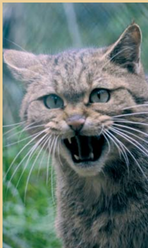
Chat sauvage du parc animalier de Thale

Le théâtre de montagne du Harz (Harzer Bergtheater), situé dans une gorge qui s'ouvre vers le nord-est, est une attraction très particulière. Son fondateur, Ernst Wachler, le fit édifier en 1903 sur le modèle des amphithéâtres grecs. Si vous souhaitez assister à une représentation théâtrale, nous vous recommandons d'être sur place suffisamment tôt pour apprécier le grandiose panorama de l'avant-pays du massif du Harz avant de vous tourner vers la scène.