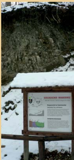
Affleurement le long du chemin de randonnée géologique

Ce versant est une particularité géologique d'importance internationale. Le long du circuit de randonnée géologique très bien balisé, nous découvrons également l'ouverture de l'ancien gisement de boue thermale. Les différents affleurements sont accompagnés de panneaux informatifs.