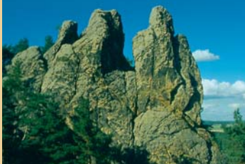
Formation rocheuse Hamburger Wappen