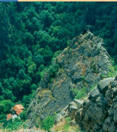
L'auberge Königsruhe vue depuis le Rosstrappe

Les alentours de la gare de Thale offrent tous les jours suffisamment de places de stationnement. De là, quelques minutes nous suffiront pour atteindre la station inférieure du télésiège. C'est le moyen le plus commode pour accéder au rocher Rosstrappe (N51°44.131', E011°01.071'). Aux amateurs de randonnées, nous recommandons toutefois l'itinéraire suivant: Präsidentenweg – Eselsteig – Rosstrappe. Le Präsidentenweg (chemin du président) part de la vallée de la Bode, juste derrière la station inférieure du téléphérique. Après notre passage sous les câbles du