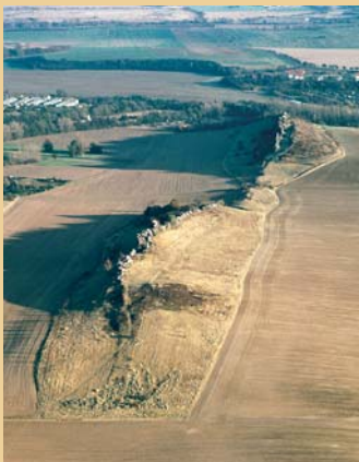
La formation rocheuse Teufelsmauer vue d'en haut

L'imposante formation rocheuse Teufelsmauer (mur du diable) n'est pas un mur construit de main d'homme, et ce n'est pas non plus l'œuvre du diable. Selon la légende, Dieu et le diable voulaient partager la Terre entre eux. Pour ce faire, ils avaient convenu que tout le pays que le Diable entourerait d'un mur en une seule nuit et jusqu'au premier chant du coq lui appartiendrait. Le diable se mit au travail et avait presque terminé. Une femme, qui s'était mise en chemin dès avant l'aube pour vendre son coq sur le marché, trébucha ; le coq prit peur et se mit à crier. Hélas pour le diable, le temps de