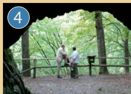
Le passage menant au point de vue panoramique Wilhelmsblick