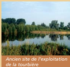
Ancien site de l'exploitation de la tourbière