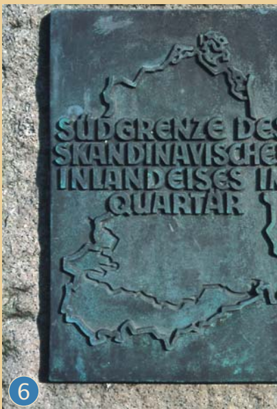
6 Friedrichsbrunn : pierre commémorative des périodes glaciaires

de la République Démocratique Allemande (RDA) qui cessa d'exister en 1990. Le Preussischer Saalstein (N51°43.006' ; E011°06.081') marque une autre frontière, à savoir celle entre le duché d'Anhalt et le royaume de Prusse. Cette formation rocheuse est située sur le côté gauche de la vallée Kaltes Tal (Vallée froide) entre Friedrichsbrunn et Bad Suderode. De même que l'Anhaltischer Saalstein qui lui fait vis-à-vis (voir le dépliant consacré au site n° 15 ), le Preussischer Saalstein est une imposante falaise rocheuse accompagnée d'éboulis de granite à deux micas issu du massif igné du Ramberg. Friedrichsbrunn est à la fois point de départ et point d'arrivée du circuit Köhlerhüttenweg, aménagé sur une longueur de 8,5 km. Ce circuit longe les témoins du métier de charbonnier, de la sylviculture et des anciennes activités minières (entonnoirs d'effondrement, bouches de puits). Le chemin est renseigné par le symbole de la charbonnière (fabrication de charbon de bois). L'ancienne frontière entre le royaume de Prusse et le duché de Brunswick (Braunschweig), qui fut tracée et marquée dans le cadre des premiers travaux d'arpentage prussiens en 1844, traverse le site n° 9 du nord vers le sud.