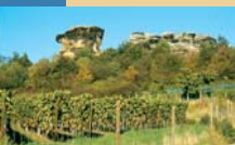
Viticulture sur le Königstein

L'existence d'un vignoble sur le Königstein est réelle. Dans la langue populaire, cet imposant massif (N51°48.684' ; E011°03.165') est appelé Kamel (chameau) en raison de sa silhouette qui évoque un chameau au repos. Comme pour le Schlossberg de Quedlinburg, le grès « durci » du Königstein (190 m d'altitude) est caractéristique du versant sud de l'anticlinal de Quedlinburg. Les grès de cet endroit, également imprégnés de silice, sont devenus « quartzeux », ce qui a conféré une grande dureté à la roche. La surface ondulée des parois rocheuses est due à la présence de minces filons silicifiés et de zones de lithification irrégulière. À l'endroit où la nouvelle route nationale B6 traverse la haute chaîne fut découvert, dans le cadre des travaux préparatoires de construction, un site tombal complexe relevant de la culture des amphores globulaires, qui remonte à l'âge moyen de la pierre (environ 3000 à 2800 avant J. C.).