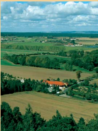
Vue sur l'hôtel Helsunger Krug depuis la formation rocheuse Teufelsmauer