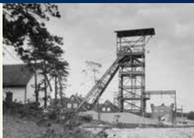
Förderturm auf dem "Soldatenkopf"