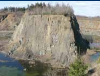
Steinbruch im Winter

Rund um den Diabas-Steinbruch auf dem Heimberg bei Wolfshagen führt der Themenpfad "Spur der Steine". Dort befindet sich nicht nur die Stempelstelle Nr. 109 der Harzer Wandernadel; Informationstafeln rahmen den malerischen Blick in den renaturierten Steinbruch ein. Was im Jahr 1885 als handwerklicher Betrieb begann, wandelte sich in den 1960-70er Jahren zu einem Betrieb mit einer Jahresproduktion von knapp 1 Mio. t. Bis 1986 wurde der wegen seiner hohen Druckfestigkeit und sehr guten Frostbeständigkeit für den Verkehrswegebau stark nachgefragte Rohstoff gewonnen. Entstanden war das grünliche Gestein vor etwa 380 Mio. Jahren untermeerisch aus in Tonschlamm eindringenden Magmen. Dank regelmäßiger Pflege ist der aufgelassene Steinbruch ein einzigartiger Lebensraum für seltene und geschützte Tier- und Pflanzenarten.