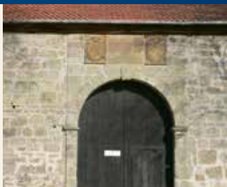
Teilansicht Gutshof Alt Wallmoden

Langelsheimer Chlorkaliumfabrik. Dort waren Kalisalze der im Harly gelegenen Grube „Hercynia“ verarbeitet worden. Die laugenreichen Wässer traten dann u. a. an der Karstquelle Kirschensoog aus. Diese und weitere Karstquellen liegen in der Innerstemulde. Die Muldenfüllung besteht aus verkarstungsfähigen Kalken der Oberkreide. Zum Muldeninneren werden die Kalke von schwer wasserdurchlässigen Mergeln überdeckt. Durch diese wird das Karstwasser gestaut und gelenkt.