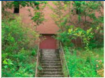
Die Natur auf dem Vormarsch

Ruhrgebiets verglichen werden. Abgebaut wurde eine Trümmererzlagerstätte der Unterkreide im Tage- und Tiefbau. Nach einer ersten Bergbauperiode (ab 1857) erlebten die Gruben eine wechselvolle Geschichte. Während der Aufrüstung Deutschlands vor dem Zweiten Weltkrieg wurden die Aufschluss- und Ausbauarbeiten neu belebt. Mit dem Durchschlag der Verbindungstrecke Fortuna – Morgenstern auf der 50 Meter-Sohle bestand ab 1959 ein untertägiger Verbund beider Bergwerke. Die höchste Einzelförderung erreichte Fortuna im Jahr 1959 mit 593.100 Tonnen. 1961 nahte bereits das Ende. Die Stahlunternehmen im Ruhrgebiet beschlossen, keine inländischen Eisenerze mehr abzunehmen. Importerze waren billiger. So wurde die Grube 1963 stillgelegt.