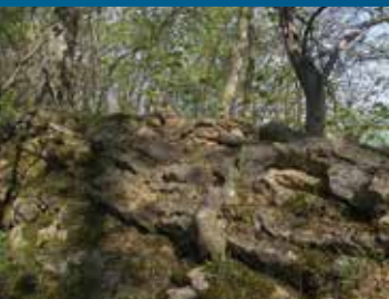
Aufschluss auf dem Butterberg

In der Geißmarstraße in Bad Harzburg befindet sich am Friedhof ein Parkplatz. Von hier sind es nur wenige Schritte in Richtung auf den vor uns liegenden Butterberggrücken. Eine Informationstafel erläutert Details zum geologisch und vegetationskundlich interessanten Bergrücken. Die Sedimentgesteine, aus denen der Butterberg besteht, wurden während des letzten Vorstoßes des Kreidemeeres von Norden küstennah abgelagert und später verfestigt. Die Brandung des Kreidemeeres zerschlug die dickbankigen Schichten des Oberen Jura. Daher findet sich am Butterberg eine gemischte Fossilienfauna aus Kreidezeit und Jura. Mit dem Aufstieg des Harzes ab der Oberen Kreide wurde auch der Butterberg herausgehoben. Er ist mit seiner Härtlingsrippe aus Kalksandsteinen der Sudmerberg-Formation aus dem Mittleren Santon ein Teil der Nordharzrand-Aufrichtungszone.