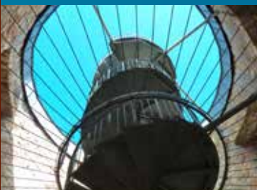
Wendeltreppe im Hausmannsturm

Im Territorialstreit mit den Welfen hatte Bischof SIEGFRIED II. im Jahr 1291 die Harlyburg bei Viernburg zerstören lassen. Zur Sicherung der Ostgrenze des seit 1235 souveränen Bistums Hildesheim ließ er danach die „Levenborch“ errichten. Diese kam zwar durch den Quedlinburger Rezess von 1523 zeitweilig in den Besitz der Fürsten von Braunschweig-Wolfenbüttel, doch wurde der Quedlinburger durch den Hildesheimer Hauptrezess von 1643 wieder aufgehoben. Gut 100 Jahre später ließ CLEMENS AUGUST VON BAYERN (1700 – 1761) die wehrhafte Levenborch abreißen und an ihrer Stelle das heutige Barockschloss erbauen. Der Kurfürst und Erzbischof von Köln war auch Bischof von Hildesheim. Von der Burg blieben nur Reste, darunter der 1991 sanierte Hausmannsturm, von dem sich ein wunderbarer Ausblick über den Salzgitterschen Höhenzug bietet.