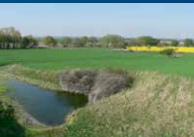
Periodische Karstquelle Kirschensoog

Zwischen Wallmoden und Alt Wallmoden fließt die Neile, ein linker Zufluss der Innerste. Nahe einer Brücke über die Neile entlang der K 67 befindet sich auf einem Feldstück die Karstquelle Kirschensoog. Die periodische Quelle liegt in einer ca. 4 m tiefen Mulde. Wasser führt sie meist nach starken Niederschlägen oder nach der Schneeschmelze. Dabei kann eine Schüttung von ca. 1.000 /s entstehen, was in etwa dem Inhalt von sieben gefüllten Badewannen entspricht. Die Quelle entwässert in die Neile und fungiert als „Überdruckventil“ eines unterirdischen Karstgerinnes. Das erstreckt sich entlang einer Luftlinie von ca. 27 km bis nach Goslar. Das Karstwasser bewegt sich mit Fließgeschwindigkeiten um 100 m/h. Örtlich markieren Erdfälle den Verlauf der unterirdischen Fließwege. Entdeckt wurden die Fließwege 1889 durch Versenkung von Endlaugen der