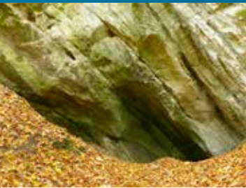
Eingang zur Kräuter-August-Höhle

Nördlich des Klosters in Wöltingerode liegt der Harly. Der salztektonisch gebildete Schmalsattel des Harly verläuft parallel zum Harz. Im Westteil ist durch den Aufstieg des Salzes und die damit verbundene Heraushebung eine Abfolge vom Unteren Buntsandstein bis zum Oberen Muschelkalk aufgeschlossen. Auf der Südseite des Harly befinden sich Relikte des ehemaligen Vienenburger Kalibergwerks Hercynia. Mit der Gründung der Gewerkschaft Hercynia 1883 begann die rasante Entwicklung des Kalibergbaus außerhalb des Staßfurter Raumes. Schon lange zuvor war im Harly auch Gips abgebaut worden. Der „Alabaster von Wöltingerode“ fand bereits im Jahr 1571 schriftliche Erwähnung. Heute ist der Harly Teil des Fauna-Flora-Habitat-Gebietes Harly, Ecker und Okertal bei Vienenburg.