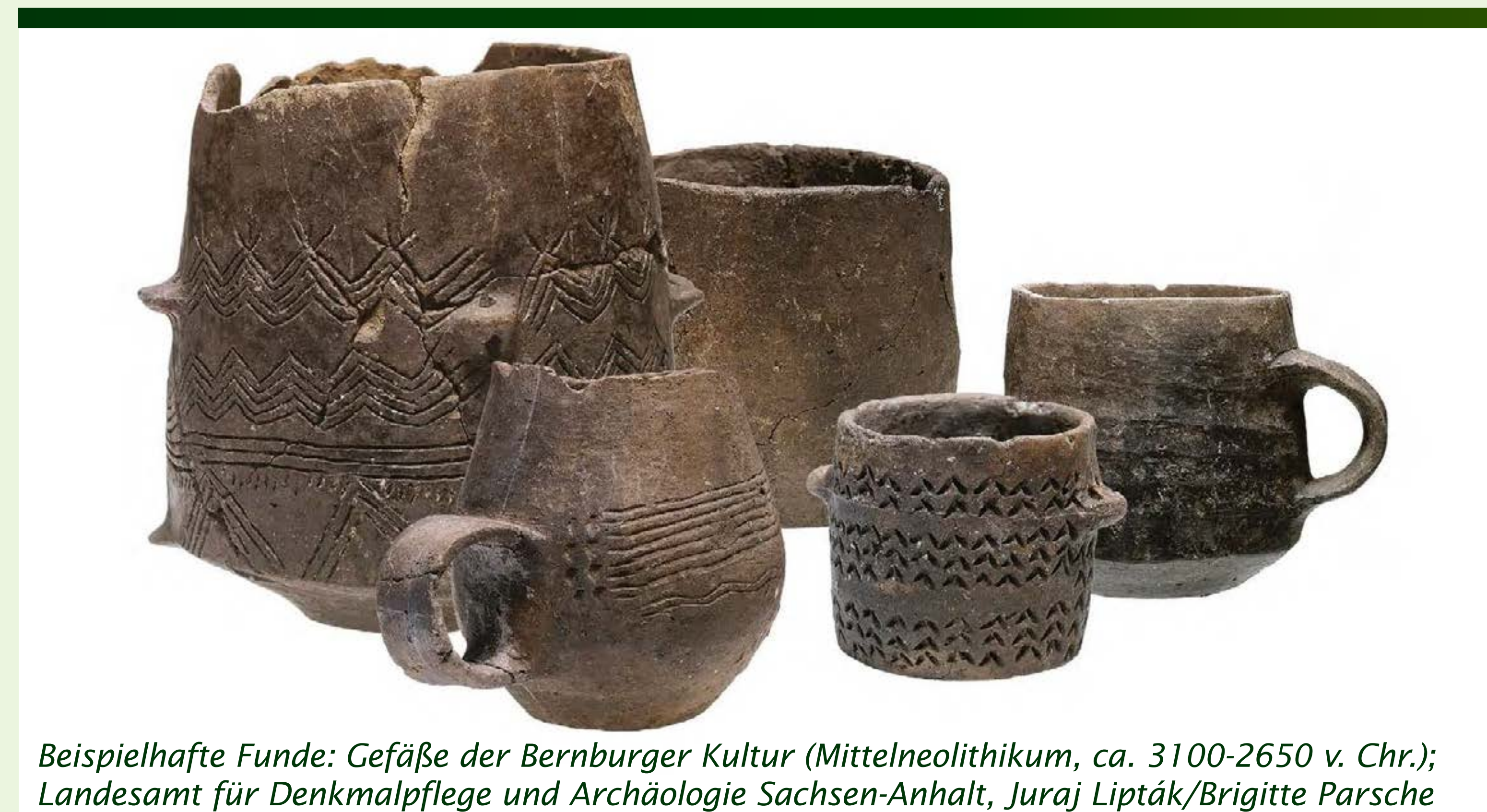
Beispielhafte Funde: Gefäße der Bernburger Kultur (Mittelneolithikum, ca. 3100-2650 v. Chr.)