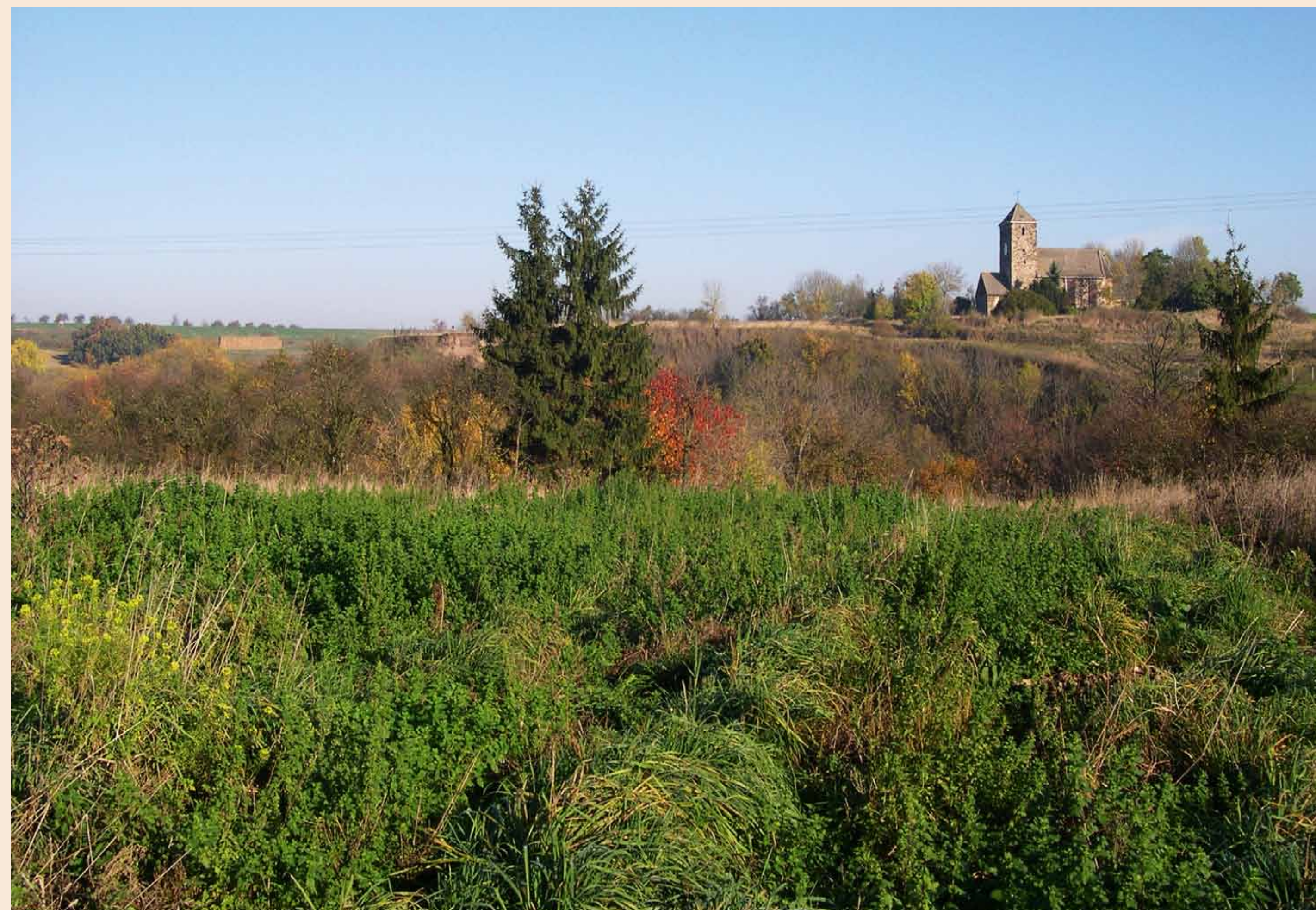
Blick von der „Heiligen Breite“ auf den Burgberg Bösenburg

Die Kirche St. Michael thront noch heute auf dem Burgberg. Der Innenraum der Kirche mit einem romanischen Westturm und einem spätgotisch erweiterten Schiff ist kunstvoll bemalt. Auf dem Friedhof und in der Vorhalle stehen mehrere prächtige barocke Grabsteine, die von einheimischen und zugewanderten Steinmetzen aus Bösenburger Sandstein im 17. und 18. Jh. gefertigt wurden. Daher stammt auch der Begriff „Bösenburger Steinmetzschule“. Die evangelische Kirche wird bis heute von den Bewohnern Bösenburgs genutzt und gepflegt.