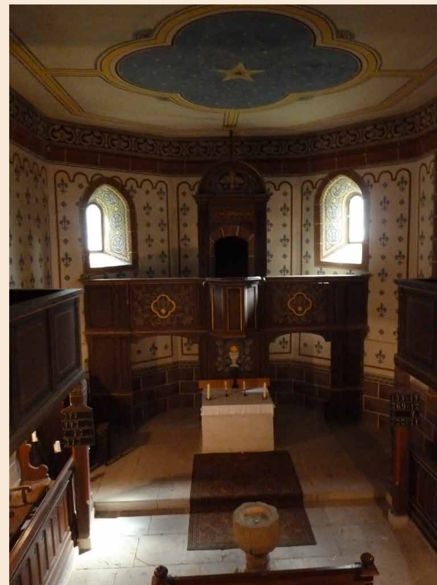
Innenraum der Kirche St. Michael