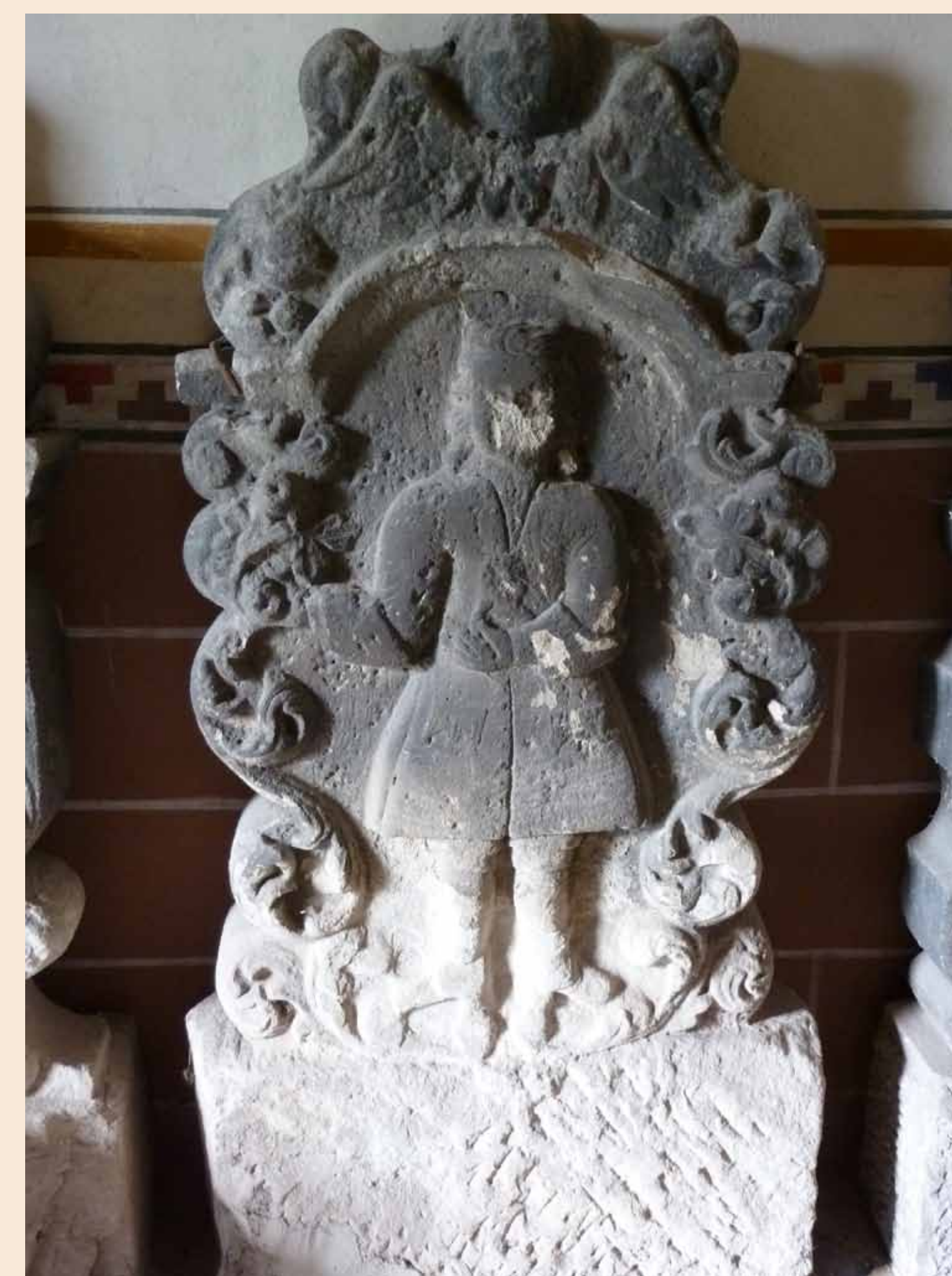
Grabmal aus Bösenburger Sandstein