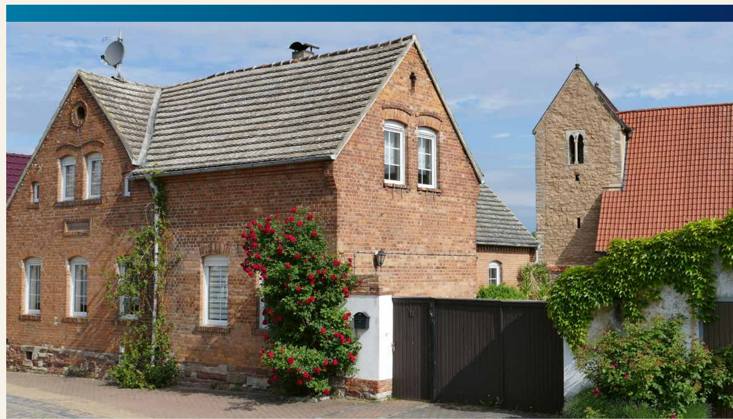
Haus Straße des Friedens 11 mit Bruchsteinsockel