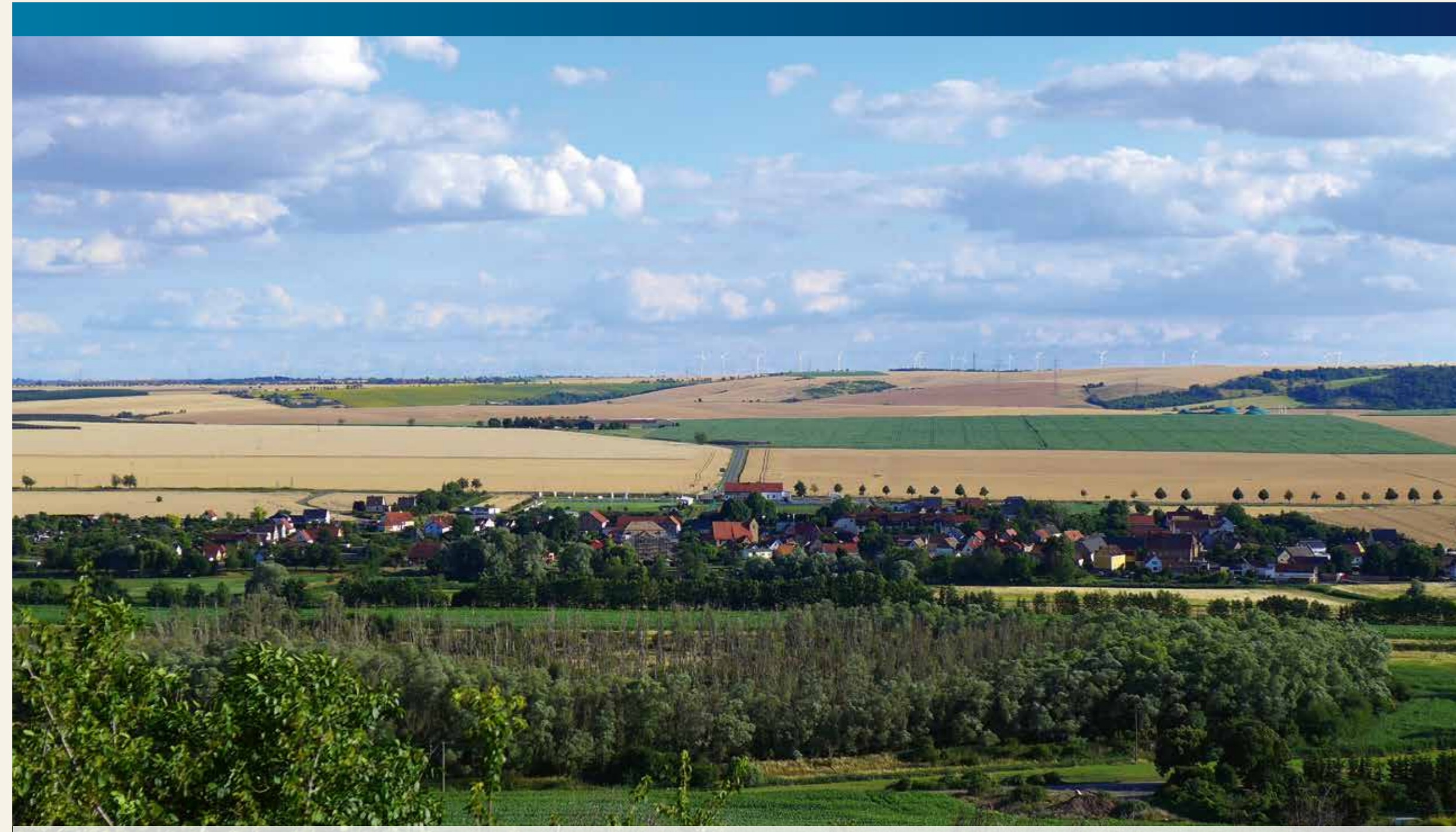
Blick übers Tal der Bösen Sieben auf Lüttchendorf