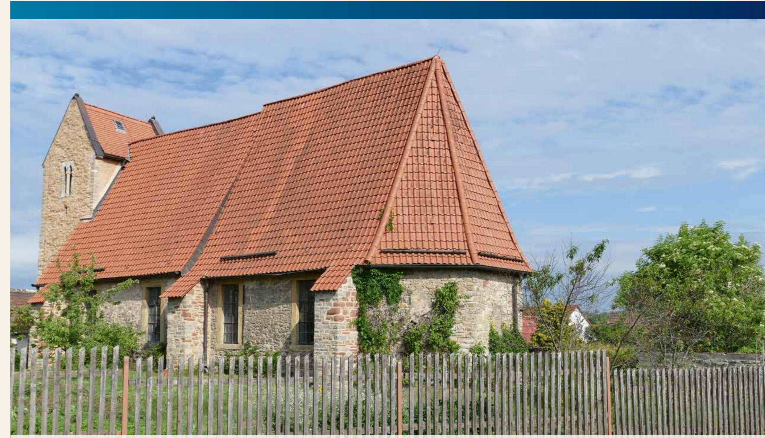
Kirche St. Fabian und St. Sebastian in Lüttchendorf