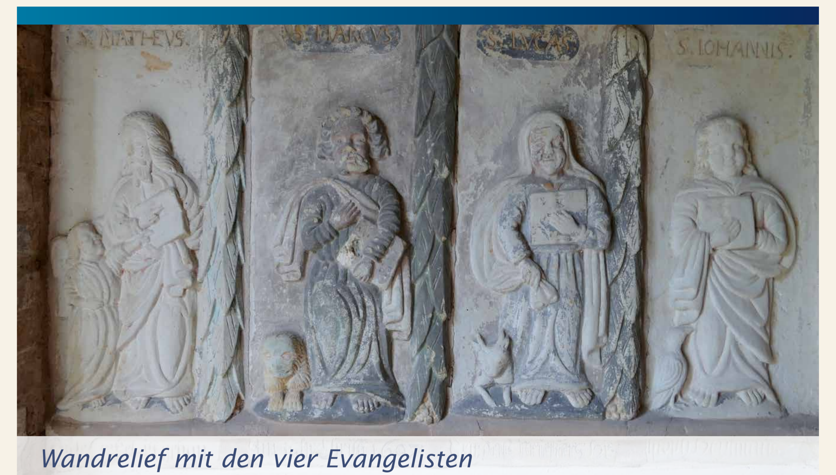
Wandrelief mit den vier Evangelisten