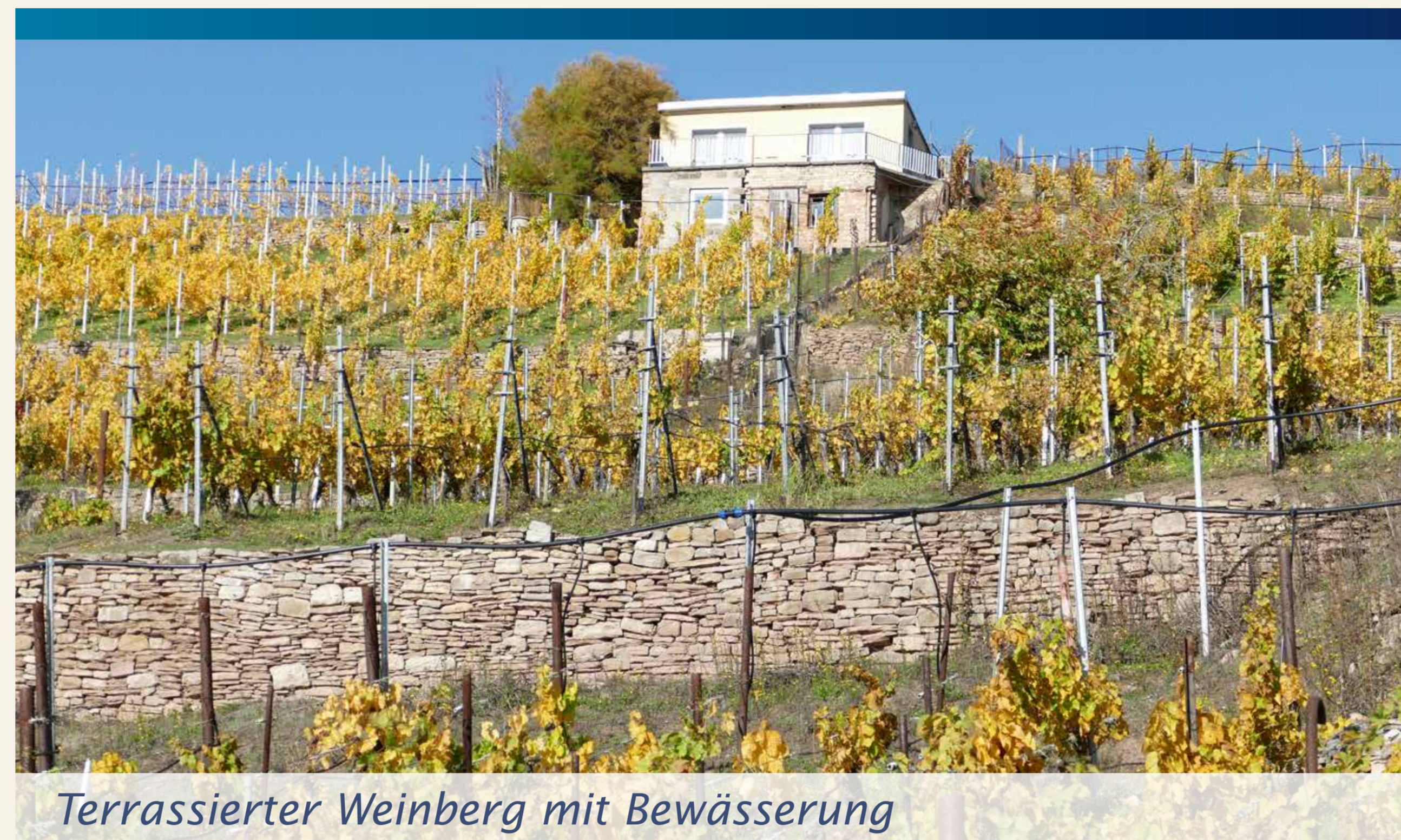
Terrasierter Weinberg mit Bewässerung