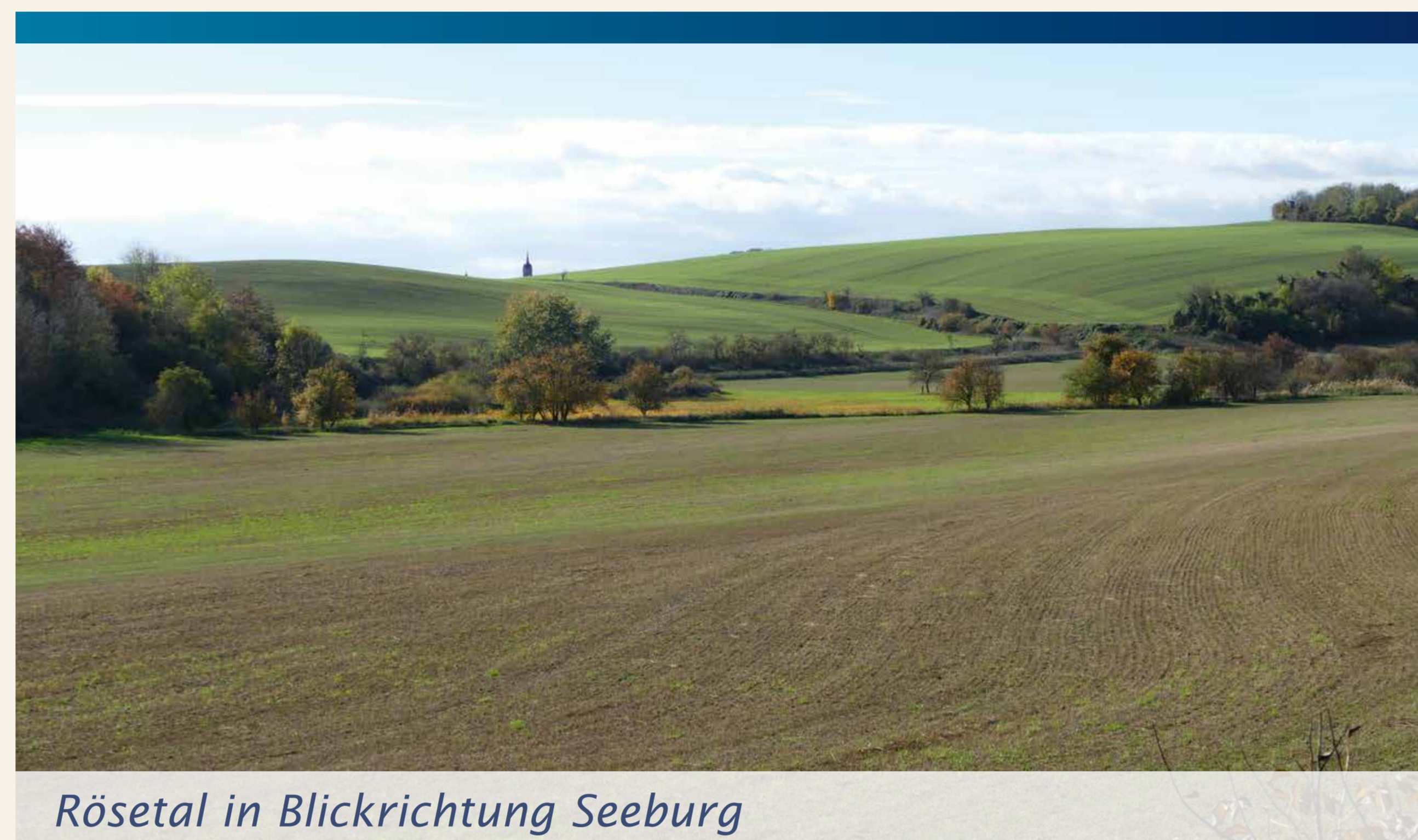
Rösetal in Blickrichtung Seeburg