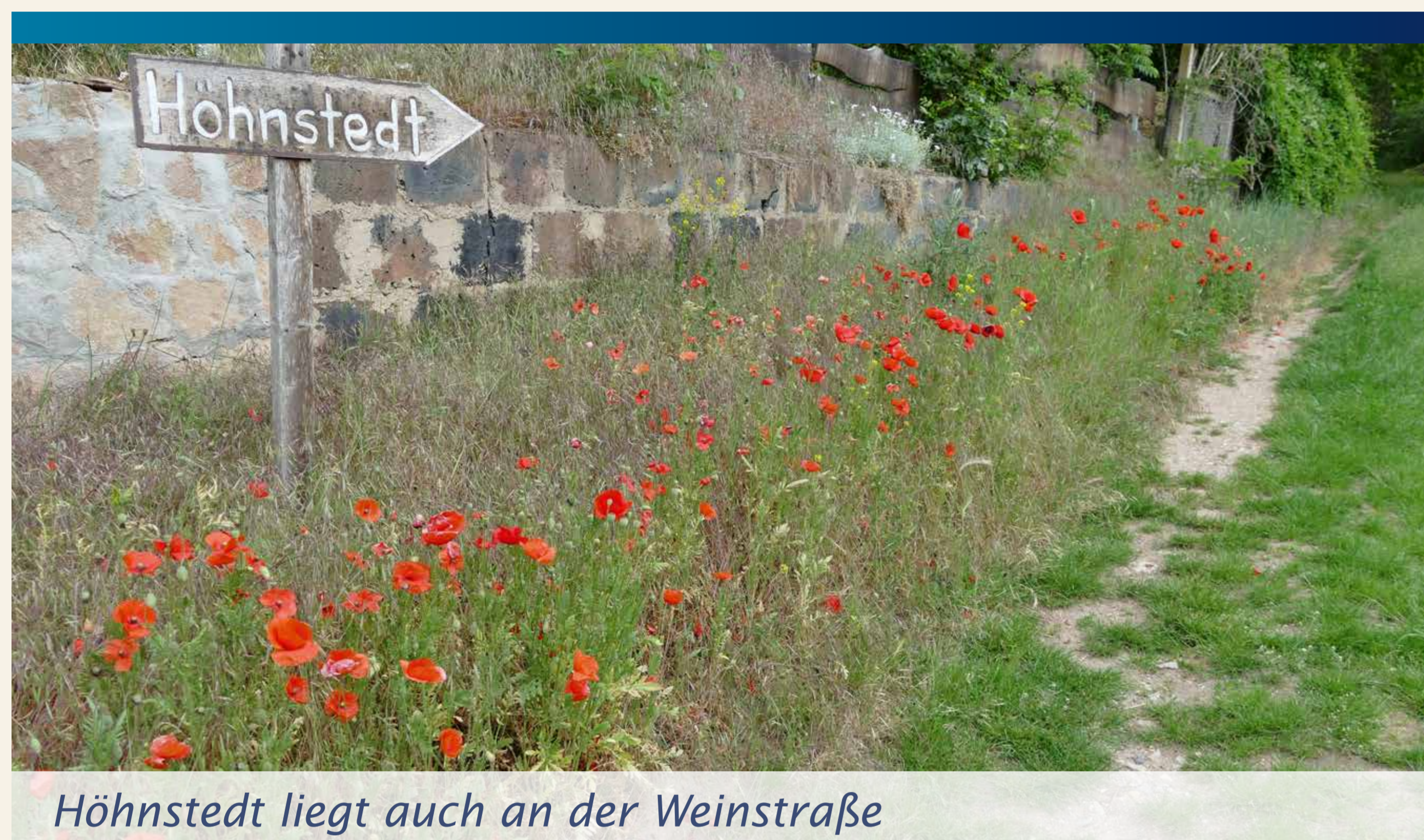
Hohnstedt liegt auch an der Weinstraße