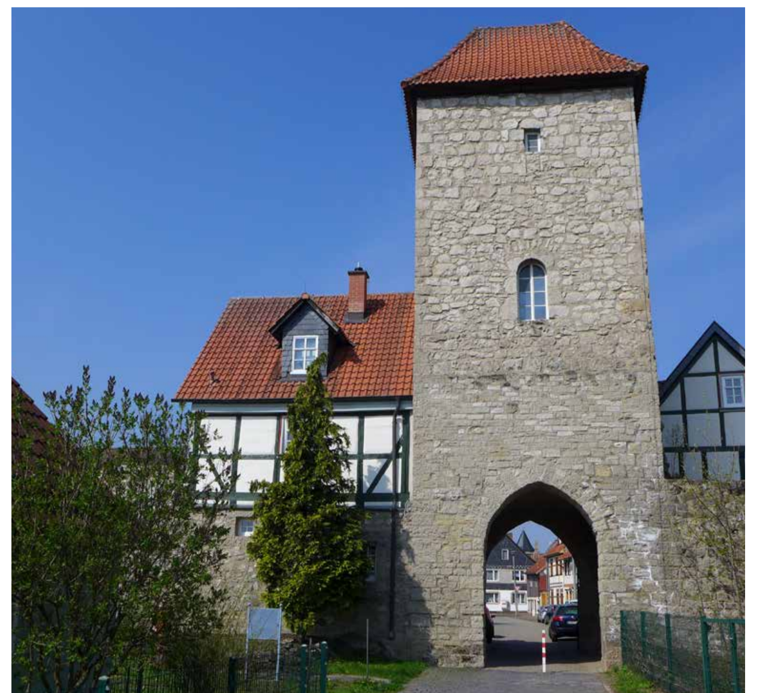
Stadtmauer mit Wernaer Tor Town wall with the Wernaer Gate