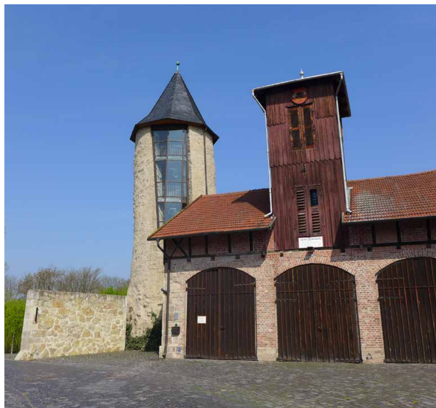
Ravensturm und Feuerwehrmuseum Ravensturm Tower and Fire Brigade Museum

Als ab 1. August 1869 die Südhartzbahn zwischen Northeim und Nordhausen durchgängig befahrbar war, begann für Ellrich eine Zeit des wirtschaftlichen Aufschwungs. Eine Reihe von Unternehmen der Gipsindustrie entstand. Waren dort im Jahr 1880 etwa 60 Arbeiter beschäftigt, so hatten im Jahr 1904 bis zu 500 Arbeiter eine Anstellung gefunden. Die Produktion aus Ellrich deckte um 1890 über die Hälfte des gesamten Gipsbedarfs Norddeutschlands ab.