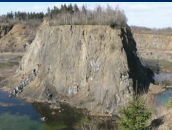
Steinbruch im Winter

Rund um den Diabas-Steinbruch auf dem Heimberg bei Wolfshagen führt der Themenpfad "Spur der Steine". Dort befindet sich nicht nur die Stempelstelle Nr. 109 der Harzer Wandernadel; Informationstafeln rahmen den malerischen Blick in den renaturierten Steinbruch ein. Was im Jahr 1885 als handwerklicher Betrieb begann, wandelte sich in den 1960-70er Jahren zu einem Betrieb mit einer Jahresproduktion von knapp 1 Mio. t. Bis 1986 wurde der wegen seiner hohen Druckfestigkeit und sehr guten Frostbeständigkeit für den Verkehrswegebau stark nachgefragte Rohstoff gewonnen. Entstanden war das grünliche Gestein vor etwa 380 Mio. Jahren untermeerisch aus in Tonschlamm eindringenden Magmen. Dank regelmäßiger Pflege ist der aufgelassene Steinbruch ein einzigartiger Lebensraum für seltene und geschützte Tier- und Pflanzenarten.