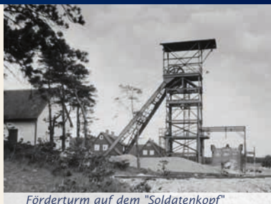
Förderturm auf dem "Soldatenkopf"