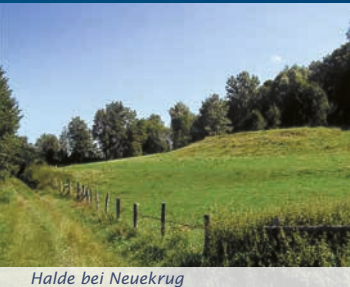
Halde bei Neuekrug

Ausgangspunkt für Geopunkt 13 ist der Parkplatz an der B 248 Richtung Seesen zwischen Neuekrug und der Kreisstraße nach Bornhausen. Auf dem Radweg führt ca. 700 m entfernt ein asphaltierter landwirtschaftlicher Weg zu einer Eisenbahnbrücke. Hier liegen die nördlichsten Ausläufer des Zechsteinzuges, der den Harz auf seiner Südseite begleitet. Dicht über der Basis des Zechsteins tritt Kupferschiefer auf, der Gegenstand des Bergbaus im Gebiet der Landmarken 12 und 17 war. Angeregt durch die wirtschaftlichen Erfolge im Mansfeldischen, versuchte man auch hier Kupferschiefer auszubeuten. Die geologischen Umstände und der geringe Metallgehalt führten aber zum Scheitern der "New Mansfield Copper and Silver Mining Company". Zurück blieben allein die Halden.