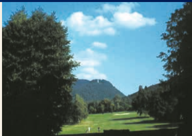
Blick zum Burgberg