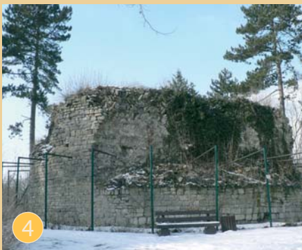
Ruine Alte Burg Aschersleben

Zurück geht es wieder mit dem Zug in die älteste Stadt Sachsen-Anhalts: Aschersleben fand 753 erstmals Erwähnung und war um 1100 Stammsitz der Askanier. Auf dem Wolfsberg 4 finden wir die Reste der ehemaligen Burg. Vermutlich im 11. Jh. wurde dort in den Hauptwall einer