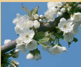
Kirschblüte in den Streuobstwiesen