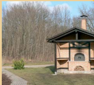
Backofen im „Tarthuner Wöhl“