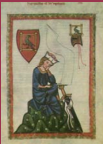
WALTHER VON DER VOGELWEIDE (um 1160 – um 1230)