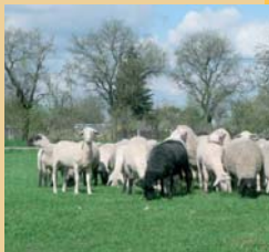
Im Frühjahr findet alljährlich in Freckleben ein Schäferfest statt.