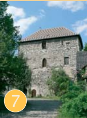
Wohnturm Burg Gatersleben

Den ältesten Kastellbau der Harzregion finden wir in Gatersleben. In der Schmiedestraße, versteckt hinter der Rathausvilla, liegt im Schatten einer Linde der Brunnen dieser Anlage. Trutzig erhebt sich noch der alte Wohnturm, dessen Untergeschoss und die beiden Wohngeschosse romanischen Ursprungs sind. Dort, wo schon im Jahre 964 erstmals eine Rundburg erwähnt wurde, ließ der Halberstädter Bischof 1179-1183 die kastellförmige Hauptburg anbauen. Die Bischöfe hielten in Gatersleben ihre Sommersynoden ab. Die Gräben der alten Wasserburg sind teilweise noch erhalten.