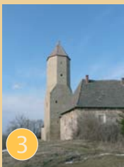
Spätromanischer Turm Burg Freckleben