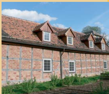
Altes Forsthaus Friedrichshohenberg