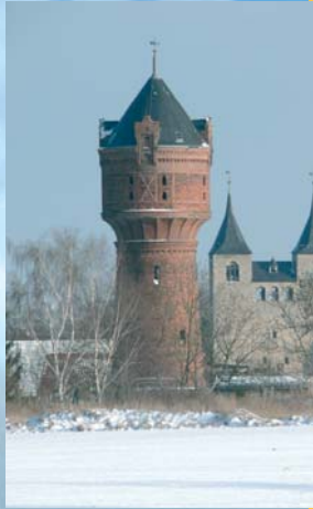
Blick zur Stiftskirche Frose

Interessieren wir uns außerdem für Zeugnisse verschiedener Architekturepochen, so finden wir eindrucksvolle Jugendstilbauten vielerorts zwischen München oder Riga, bewundern die barocke Pracht des Dresdner Zwingers ebenso, wie die unzähliger bayerischer Kirchen dieser Epoche, kennen die Renaissancehäuser von Augsburg bis Leipzig. Älter sind die Bauwerke der Gotik wie die Kathedrale Notre-Dame in Paris, der Kölner oder der Magdeburger Dom. Seltener, weil noch älter, sind Bauwerke aus der Endzeit des Frühen Mittelalters. Es sind Zeugnisse romanischer Architektur, die gleichsam seltener Tier- und Pflanzenarten in Naturschutzgebieten, in kaum einer Region Deutschlands in solcher Dichte und Vielfalt zu finden sind wie in der