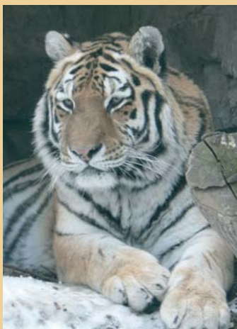
Sibirischer Tiger im Zoo Aschersleben

älteren Anlage ein mächtiger Rundturm eingebaut, der in 8 m Höhe erhalten ist und einen Durchmesser von 15,9 m mit einer Mauerstärke von 4,5 m aufweist. Heute ist ein großer Teil des Geländes der Alten Burg ein ansehnlicher Zoo, der besonders wegen seines Freigeheges für sibirische Tiger besuchenswert ist. In die Turmruine wurde eine Voliere für Uhus eingebaut. Der Uhu ist unsere größte heimische Eulenart. Gelegentlich vernehmen wir im Zoo auch ein tiefes „krrock“ oder ein raues „rrab“ überhinfiegender Kolkkraben, die in der gesamten Harzregion bis in die 1980er Jahre hinein ausgestorben waren. Drei Raben sitzen auch in einer Eiche, die im Stadtwappen von Aschersleben eine zweitürmige silberne Burg überragt. Im christlichen Altertum galt der Rabe als Bote Gottes. Kolkkraben können über 20 Jahre alt werden. Ob ihrer Gelehrigkeit gelten sie auch als weise Vögel.